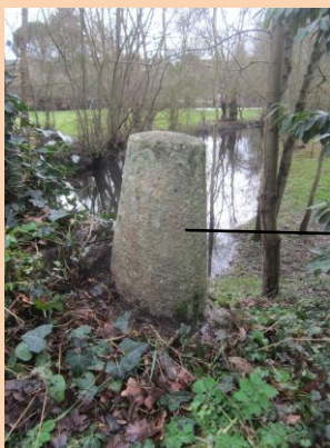
9/ Chemin du Pont Bosc.