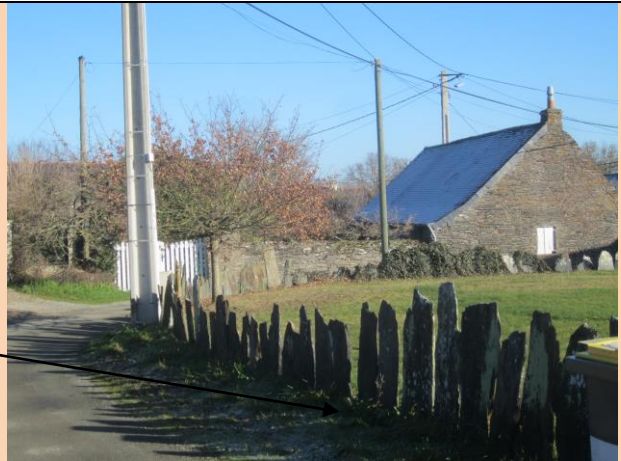
Des pauls, clotures en ardoise