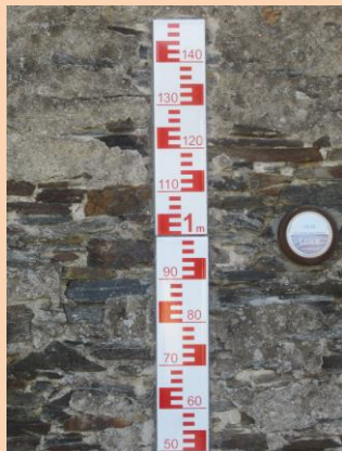
3/ Chemin du pont du magasin