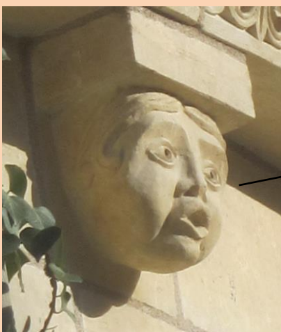
7/ Eglise de Juigné sur Loire