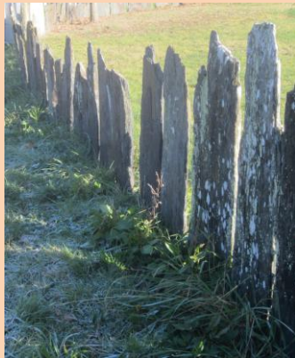
2/ 22, chemin de la Bourrelière