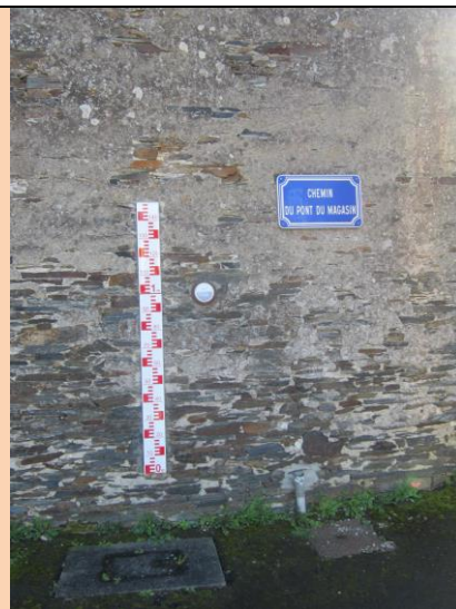
Les Magasins : lieu de stockage de négociants en vin aux 17 et 18 ème s.