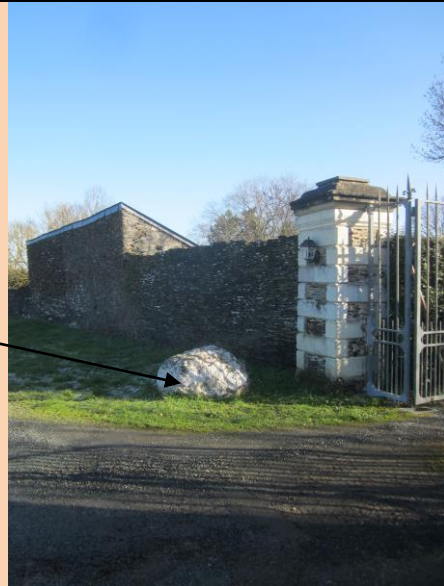
Caillou blanc pour rappeler le nom de cette demeure du 18 ème s.