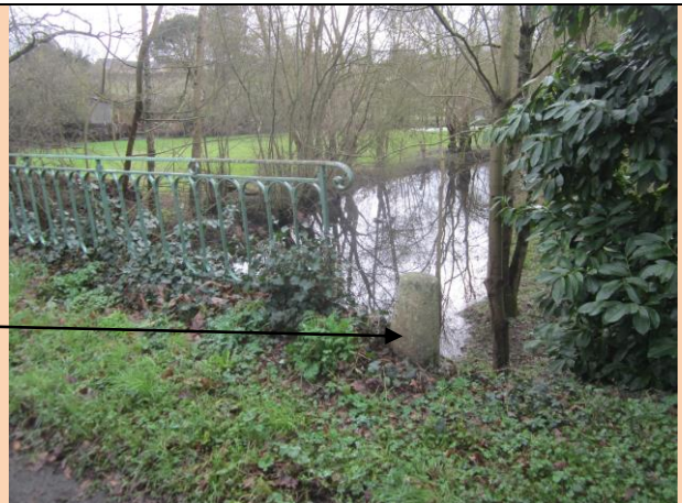
Attache pour bateaux à la Carinière.