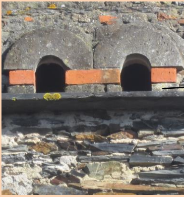
8/ 4, chemin du Clos Marchand - Martigneau.