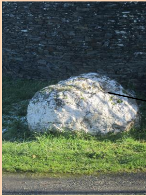
6/ Le Chaillou blanc Chemin du même nom