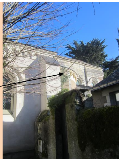
Modillon (élément d'architecture qui sert à soutenir une corniche, un avant-toit ou un balcon.) côté Monastère.